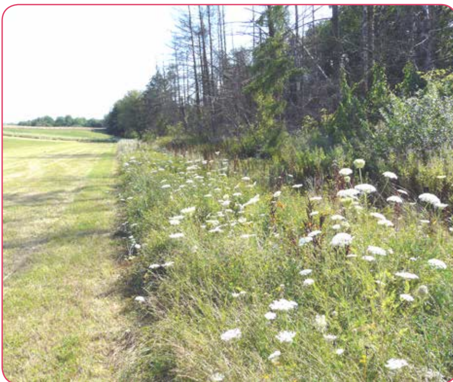
Les MAE s'est 12.000 km de haies, 4.000 mares, 2.500 km de tournières et 7.000 ha de prairie à haute valeur biologique.